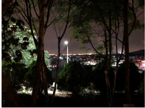
>>每個在闡外辦公寢室度過的夜晚