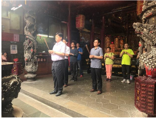
>>闡場佈置完成至鄰近土地公廟祈福