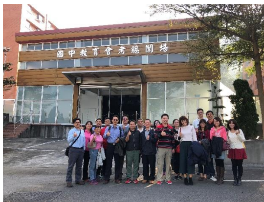
>>一中同仁至總闈場進行場勘