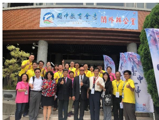
>>由教育部次長與臺中市政府教育局長共同封關後，與閱外同仁合影