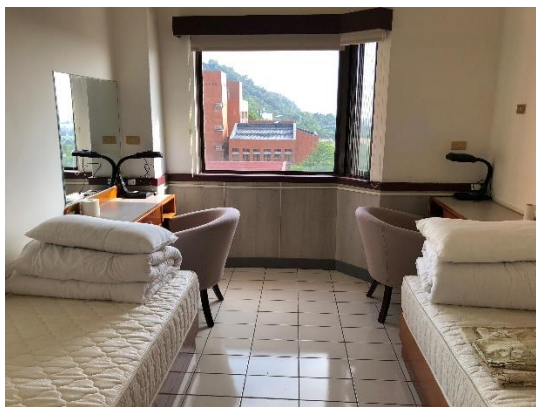
>>闡外辦公寢室位於綜合大樓 3 樓