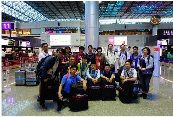
>>107 年我與臺南一中前往華東考場