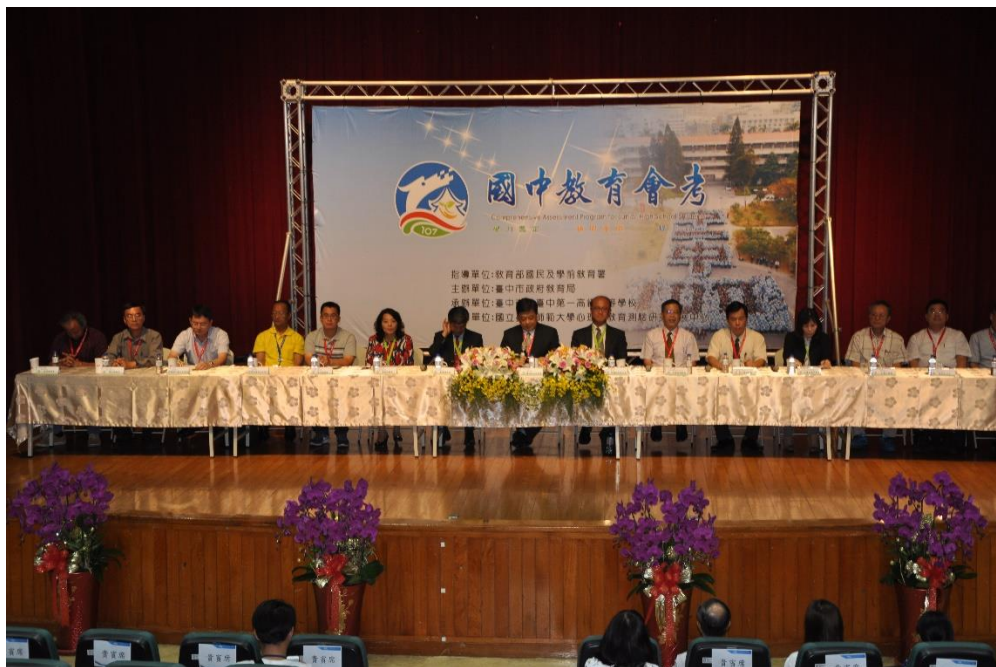
>>107 年國中教育會考的人聞記者會，教育部與臺中市政府教育局一字排開