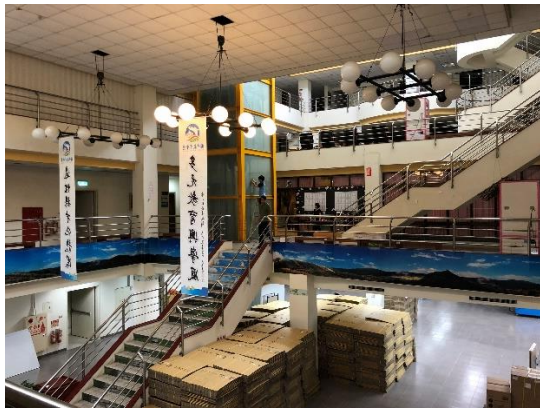
>>闡內布置大致完成的四月中旬