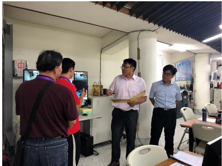
>>偉立與佳偉兩位副總幹事 >>財固總幹事與佳偉副總幹事