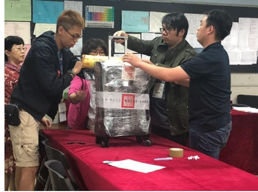
>>過中國海關後試卷箱隨即上封條