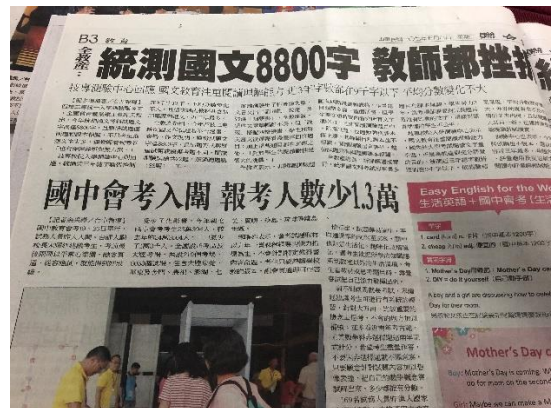
>>當年國中教育會考闖場及入闖記者會的媒體新聞露出，各大報皆可見