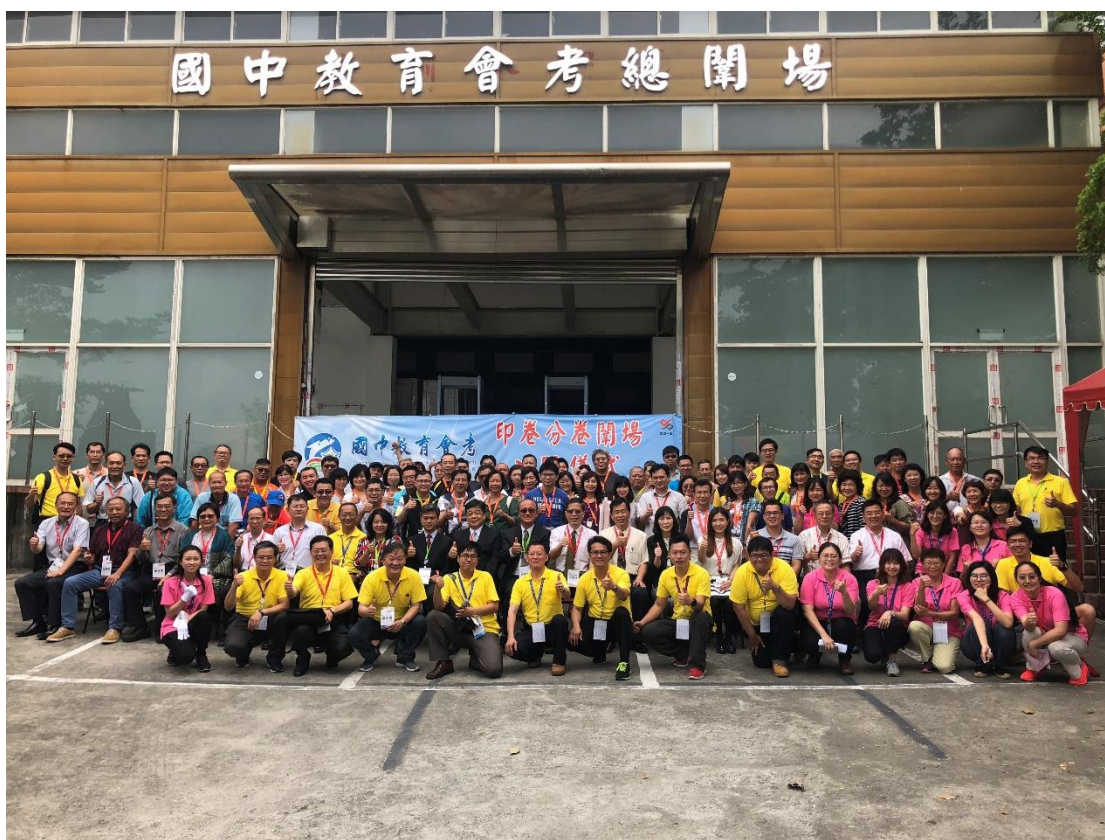
>>入闈前在總閱場入口側邊的工作幹部大合影，代表著全國試務會進展到 1/2