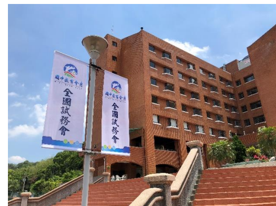
>>總闈場位於豐原的國教院臺中院區