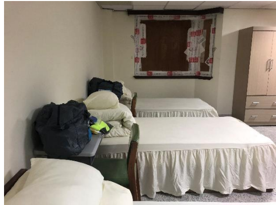
>>闡內同仁寢室須有層層封條務必保密