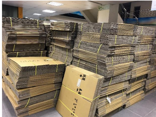
>>分卷組的裝箱器材一次就定位